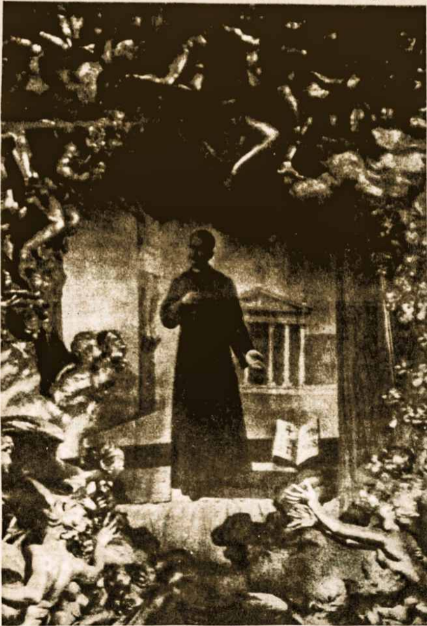
Pal. Jurgio Matulaičio paveikslas Sv. Petro bazilikoje beatifikacijos dieną.

nešti palaimą. Kiekvienas iš mūsų, kaip tos dešimties Dievo įsakymų lentelės, taip mes kiekvienas. Mes kartais užmirštam kiekvienas savo įtaką, kurią mes galim turėti savo aplinkai, savo tautai, savo šeimoms, savo artimiesiems. Ir jeigu tos palaimingos įtakos neturime, gal kaip tik dėl to, kad mūsų širdyse nėra įrašytų Dievo įsakymų, arba tik dalelę mes jų turime, o kitą dalį esame ištrynę iš savo širdžių, panaikinę, ir vaikščiojame su maža Dievo įsakymų dalele, o ne su visomis Dievo įsakymų raidėmis, žodžiais ir ne su visu turiniu. Kito būdo nešti palaimą žemei, mūsų tautai nėra. Kaip vykdyti Dievo valią, būti Dievo tarnais - nuo čia prasideda bet kokia palaima, čia yra mūsų pagrindinė misija, kurią mes kiekvienas turime vykdyti. Jeigu nebus mūsų gyvenime tarnavimo Dievui, nebus laikymosi Dievo valios, mūsų gyvenimas bus tuščias, bereikšmis, jis niekam neneš palaimos, nei mūsų kraštui, nei mūsų artimiesiems, net mes neturėsime palaimos džiaugsmo patys sau. Gyvensime be palaimos džiaugsmo, leisime savo gyvenimo