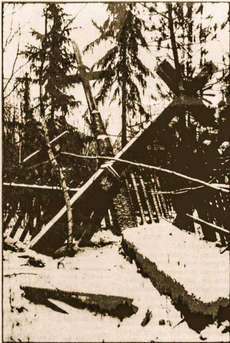
Lietuvių kapai Igarroje.

su žvakėmis tą vakarą Kaune prie Laisvės Paminklo susirinko šio miesto žmonės. Nebuvo šį kartą garsių kalbų, skambių posmų ar muzikos. Tik priešpatvidurnaktį tūkstančiai susirinkusių užgniaužę kvapą klausėsi tris minutes skambančio Laisvės Varpo. Kadaiše, veik prieš penkiasdešimt metų nutilusio, kaip tada atrodė - visiems laikams. Skambus ir tyras Laisvės Varpo balsas dangui ir žemei bylojo apie mūsų Tautos tragišką patirtį ir šviesesnės ateities lūkesčius.