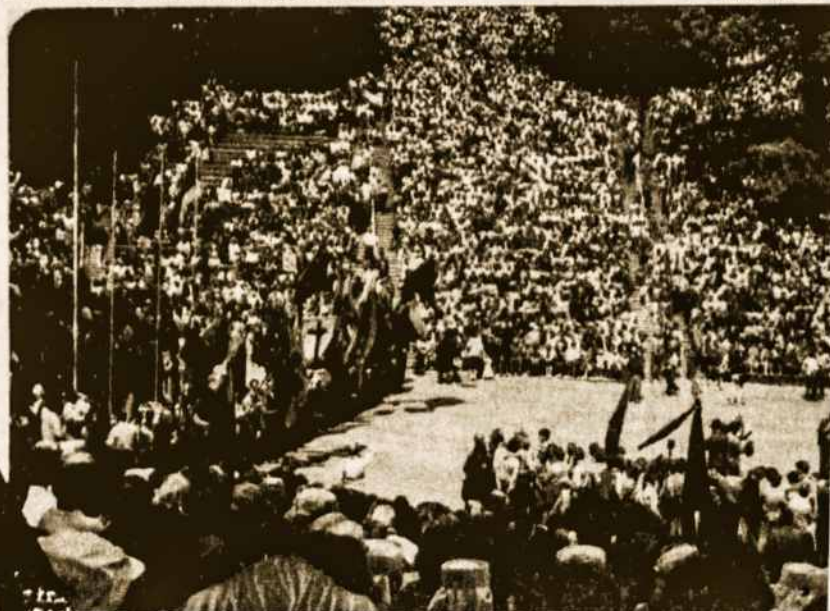
Mitingas Dainų slėnyje