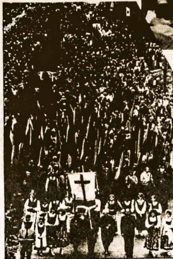
Eisena nuo Laisvės paminklo Kaune į Dainų slėnį