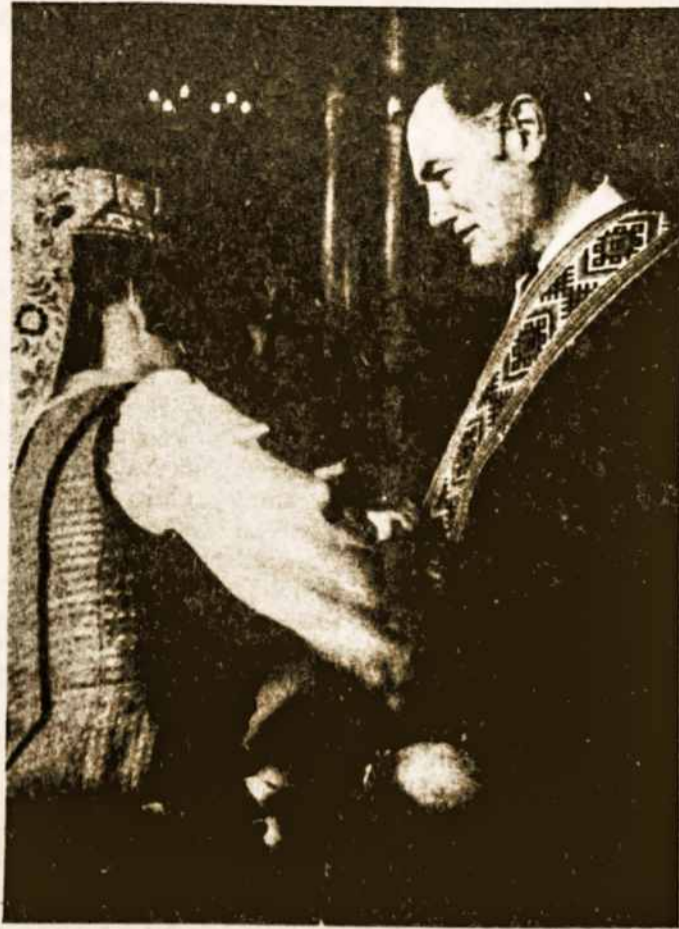
Naujasis garbės daktaras Valdas Adamkus perišamas garbės juosta...

Senatas aukštai įvertino tai, jog p. V. Adamkaus skelbtuose