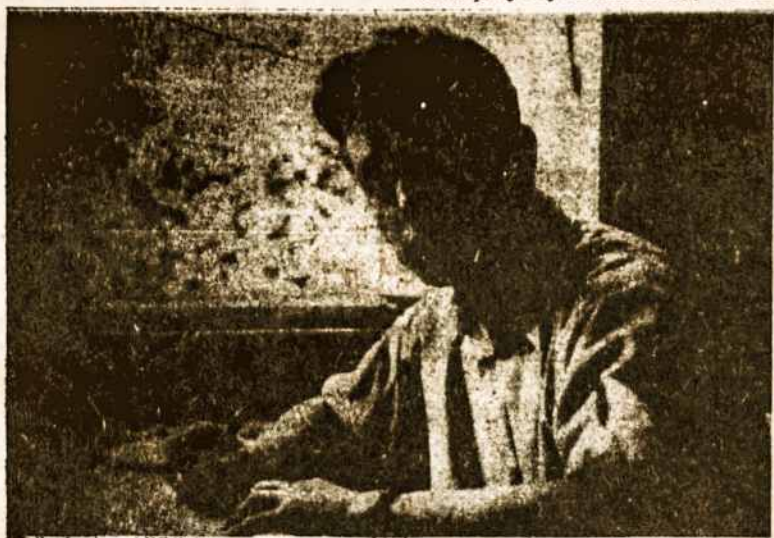
Juozas Daumantas, autorius knygos „Fighters for Freedom“, knygos rašymo metu.