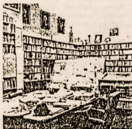
1. Melbourne lietuvių namų biblioteka, kurios knygos įtrauktos į Australijos nacionalinės bibliotekos Kanberroje fondus

Iškarpos iš "Mokslas ir gyvenimas" žurnale 6-89 tilpusio Gedimino Ilgūno straipsnio "Australija ir lietuviai":