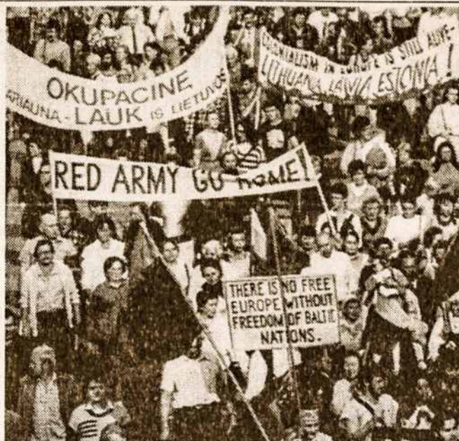
Thousands of Lithuanians demonstrate in Vilnius to commemorate the 50th anniversary of the Soviet-Nazi pact.

Estijos aukščiausioji taryba patvirtino įstatymą pagal kurį balsavimo teisė Estijoje yra suteikiama tik tiems piliečiams, kurie bent dvejus metus yra pastoviai gyvenę Estijoje. Be to, pagal priimtąjį įstatymą, Estijoje galės įsidarbinti tik tie piliečiai, kurie bent penkerius metus gyvena Estijoje. Kaip pastebi spaudos agentūros, svarstant minėtą įstatymą, Estijos aukščiausioje taryboje vyko labai gyvos diskusijos. Įstatymui griežtai priešinosi rusai deputatai, bet, nepaisant to, jis buvo priimtas didele balsų dauguma, nors ir su kai kuriais pakeitimais. Estai siekė dar labiau suvaržyti svetimšalių teisę įsidarbinti Estijoje ir dalyvauti balsavimuose. Spaudos agentūros atkreipia dėmesį, kad estai siekia kaip nors apsisaugoti nuo rusų imigrantų antplūdžio ir nuo jų įtakos Estijos viešajame gyvenime. Rusai, kurie jau sudaro apie 27-nis procentus visų Estijos gyventojų, sukelia rimta grėsmę estų tautiniam iškilimui. Estai trokšta vėl tapti savo tėvynės tikraisiais šeiminkais.