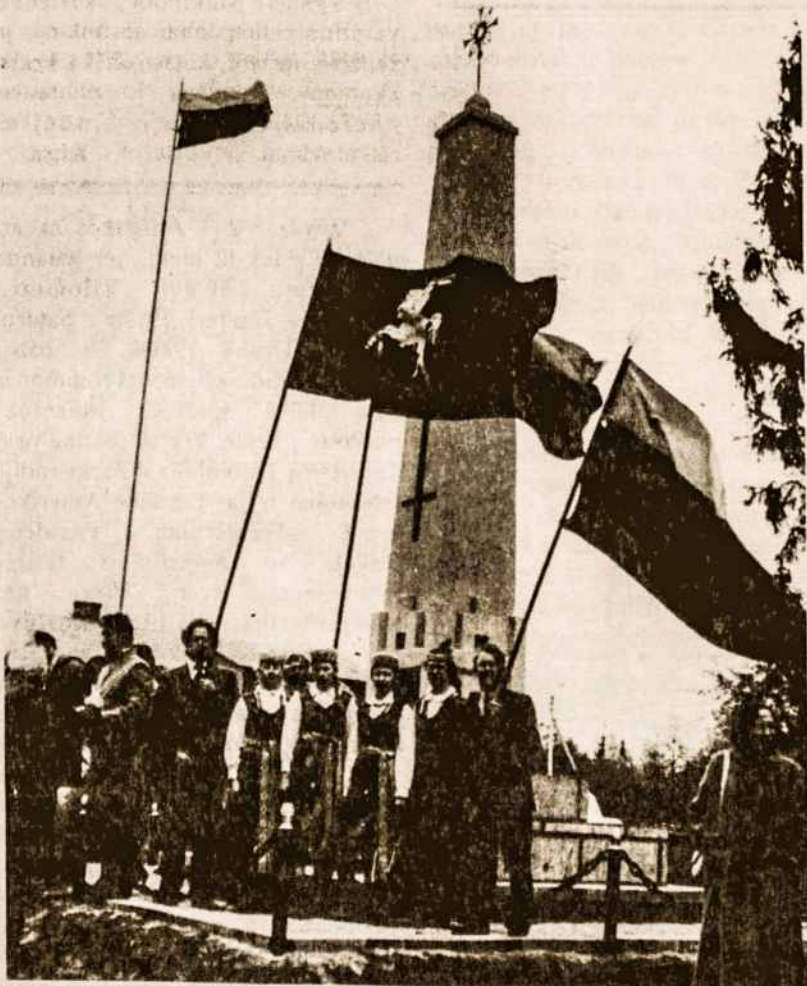
Atstatytas paminklas žuvusiems už Lietuvos laisvę Skriaudžiuose

Atstatytame paminkle žuvusiems už Lietuvos laisvę Skriaudžiuose, nauja memorialinė lenta pagaminta pagal senas nuotraukas