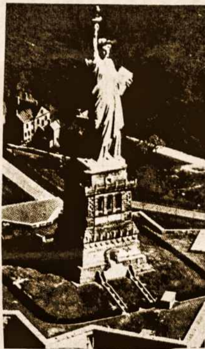
Laisvės statula JAV, Naujorko uoste

Aš skaičiau laikraštyje „Darbininkas“ labai įdomų straipsnį, kurį čia papasakosiu.