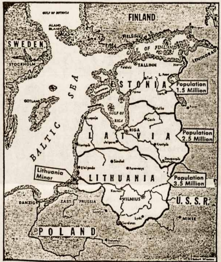
MAP OF THE BALTIC STATES Dotted line: the border imposed by the USSR on occupied Lithuania Sumažinta Maž. Lietuva - Karaliaučius, lenkams

Minėdami Vilniaus Dieną, pasvarstykime ar visi mūsų politiniai ėjimai yra teisingi, ar savo neapgalvotais veiksmais nedarome žalos savo tautai. Ypatingai būkime atsargūs spausdindami betokius lapelius su Lietuvos žemėlapiu. Niekada nemažinkime Lietuvos, nes mūsų tautos priešai tai gali panaudoti prieš mūsų interesus, sakydami: Žiūrekite patys lietuviai nenori Maž. Lietuvos ir Suvalkų trikampio ar 1920 metų sienos.