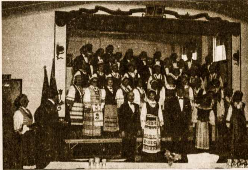
Melbourn Dainos Sambūris Geelongo Lietuvių namuose atliko Tautos šventės minėjimo programą rugsėjo 17 d.