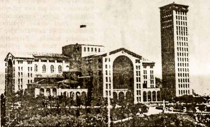
Tautinė Marijos šventovė APARECIDOJ DO NORTE