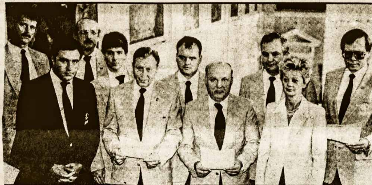
Nuotraukoje: Klyvlendo vyrų oktetas prieš koncertą Vilniaus Arkikatedroje