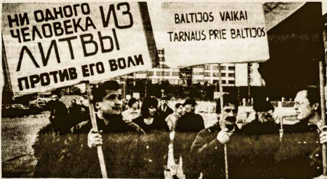
Protesters in Soviet Lithuania demonstrate against Lithuanians serving in the Soviet Army

Lietuvoje demonstruoja protestuodami dėl lietuvių tarnavimo Sovietų armijoje. Šią nuotrauką paskelbė ir „The Australian“ lapkričio 2d.