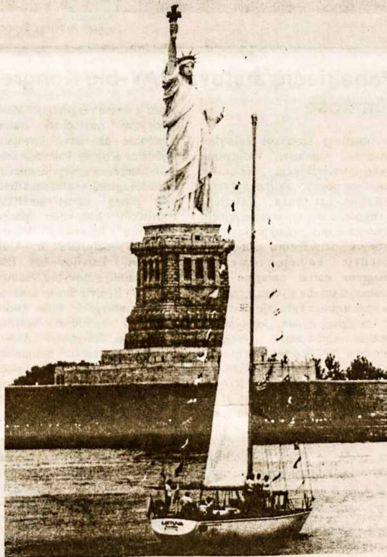
Jachta "Lietuva" prie Laisvės statulos Niujorke