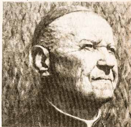
Rygos arkidiecezijos latvių vyskupas Juozapas Tancans buvęs nepriklausomos Latvijos seimo vice-pirmininkas ir ejęs prezidento pareigas tremtyje būdamas. Mirė JAV 1969. Palaidotas Grandrapids kapinėse Mičigene