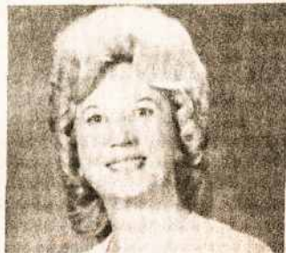
Latvių katalikų rašytoja-poetė Janina Babris mirusi prieš porą metų Amerikoje