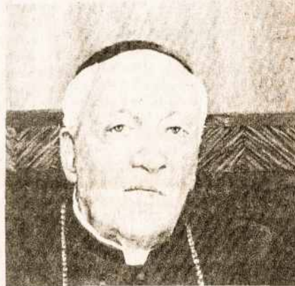
Pirmasis Latvijos kardinolas Jo Eminencija Julijonas Vainovs