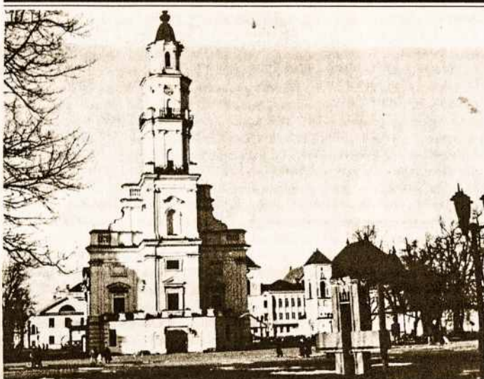
KAUNO ROTUŠĖ 1989 M.

Pasiekti du tikslai: negalėta Prancūzija, vėsta nugalėto valdovo graži duktė. Zuve, suvargę žmonės neminimi, pamirstami.