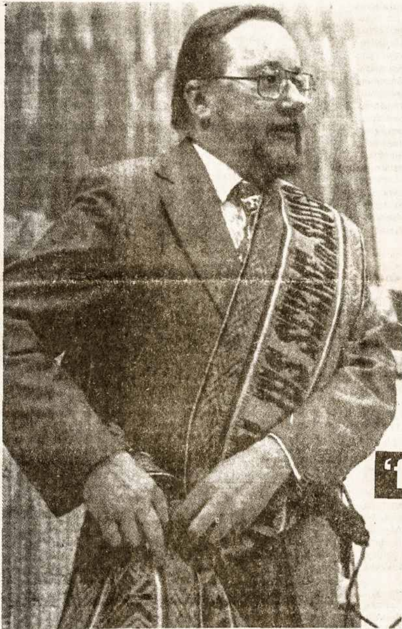
Lithuania's new President, Sąjūdis leader Mr Vytautas Landsbergis, after his election.

Pateikiame tarptautinių žinių agentūrų pranešimus iš Australijos dienraščių