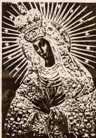
Aušros Vartų Marija