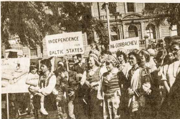
Pabaltiečiai Hobarte sveikina Lietuvą pasiskelbusią atstatanti Nepriklausomybę.