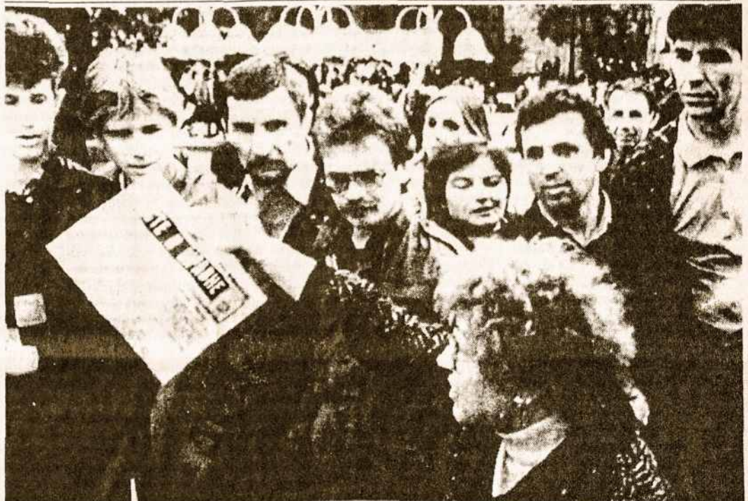
A Vilnius woman sells a Lithuanian pro-independence paper printed in Moscow because of local shortages