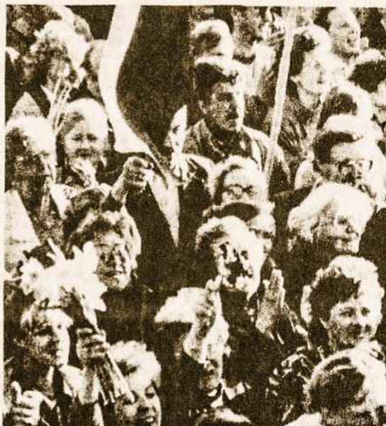
Latvians welcome the republic's bid for freedom from Moscow.

Mr Gorbachev has also condemned the Estonian moves, and insisted that the republics must abide by a recently-approved law requiring Soviet republics to hold a referendum on secession backed by two thirds of all residents.