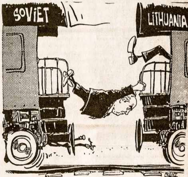
Taip vaizduojama dabartinė Lietuvos padėtis Oslo laikraštyje