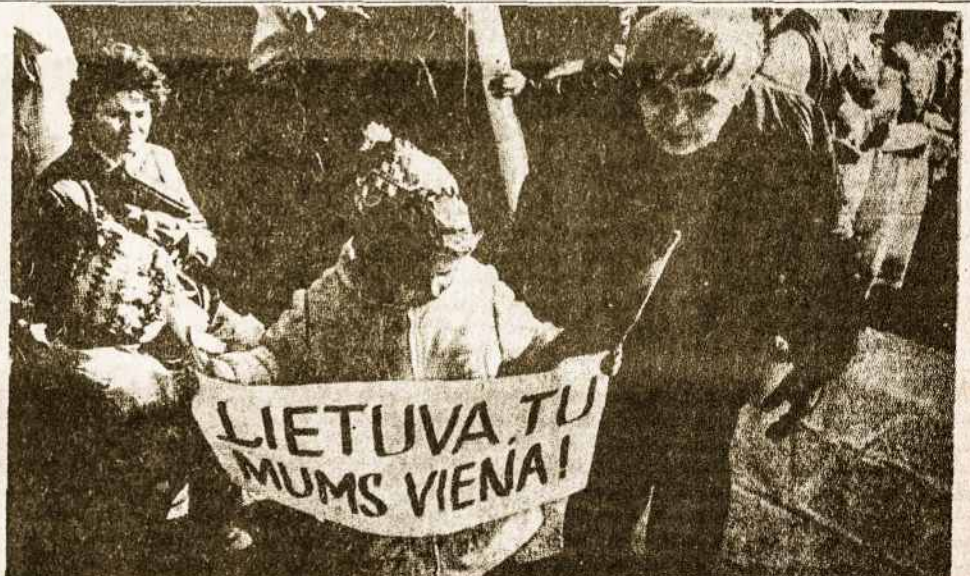
Demonstracijoje kovo 17d. prie Lietuvos Aukščiausiosios Tarybos rūmų plakatas, išreiškiantis visos tautos troškimą.

Vienas artimiausių Gorbačiovo bendradarbių Aleksandras Jakovlevas spaudos konferencijoje pareiškė, kad Maskva tik tuo atveju užmezg derybas su Vilniumi, jei lietuviai sustabds ar įšaldys kovo vienuoliktąją paskelbtą valstybinę nepriklausomybę. Jakovlevas spaudos konferencijoje paneigė gandus, kad sovietų kariuomenėje jaučiamas didėjantis nepasitenkinimas, išreiškė įsitikinimą, kad kariuomenės vadovybė remia pertvarkos politiką.