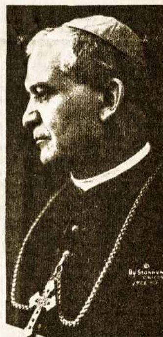
Palaimintasis Jurgis Matulaitis 1871 - 1927

Palaimintojo Jurgio Matulaičio bažnytinė šventė yra liepos mėn. 12d.