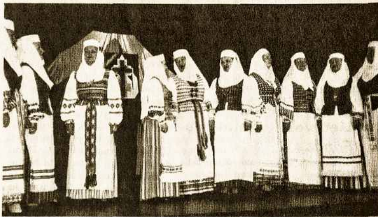
Sydnejaus „Sutartinė“ Trėmimų minėjimų programoje 1990.VI.10 Lietuvių klube.