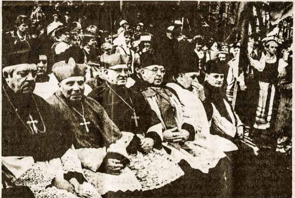
Lietuvos vyskupai vieno susirinkimo metu Kaune. Iš kairės: vysk. JUOZAS PREIKŠAS, kardinolas VINCENTAS SLADKEVIČIUS, vysk. VLADAS MICHELEVIČIUS ir kiti aukšti dvasiškiai