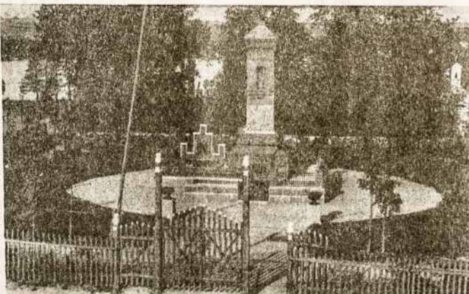
Paminklas žuvusiems už Lietuvos laisvę Sirvintų - Giedraičių Kautynėse