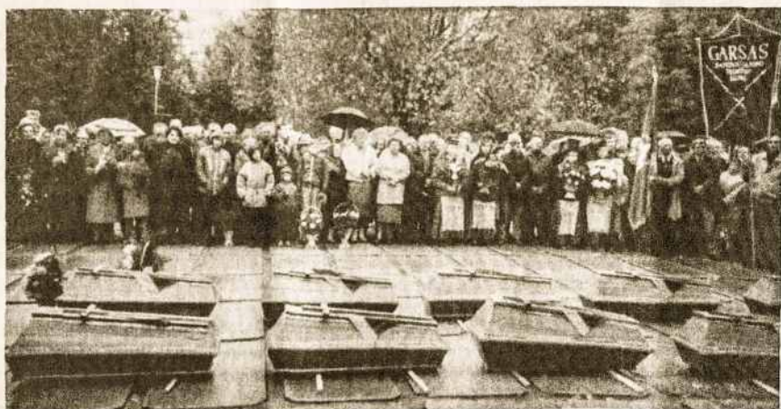
Raseiniečiai pagerbia partizanų palaikus miesto aikštėj prieš jų orias laidotuves.