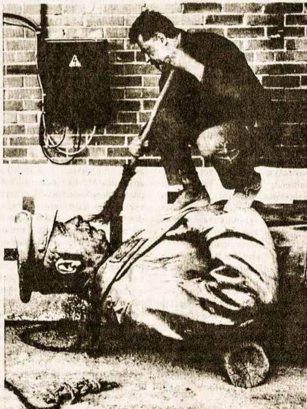
Darbininkas Lietuvoje valo dažais apteptą Stalino statulą, nuimtą nuo pakylės. Tai viena iš daugelio L. C. Price nuotraukų, kuriomis iliustruotas straipsnis apie Baltijos valstybes žurnalo „National Geographic“ 1990 m. lapkričio laidoje