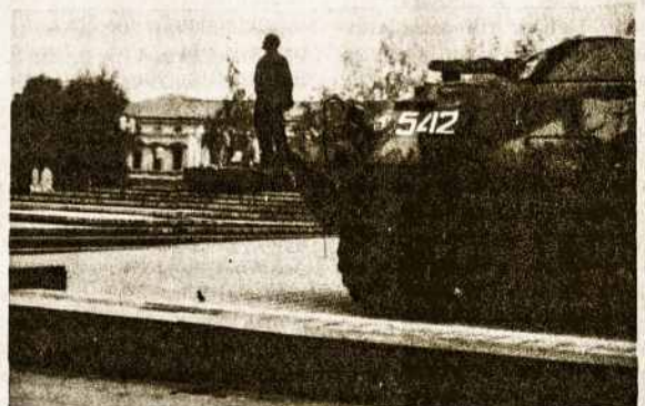
„Didžiojo“ mokytojo šūrių dienų prisiminimo palikimas Lenino paminklas Klaipėdoje saugomas keturių šarvuotųjų, kad klaidpėdiečiai jo nenuverstų. 1990 spalio 15.