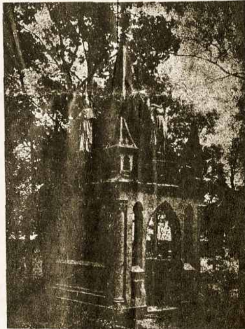
Garsiojo Tėvo Jurgio Ambroziejaus Pabrėžos antkapinė koplytėlė ant jo kapo Kretingoje. Žmonės jį laiko šventuoju.

Be abejoj, tėvą J.A. Pabrėžą šiomet plačiau prisimins ir Lietuva. Pradžiai jau padaryta. Kaip rašo savaitraštis „XXI amžius“ 3 numeryje Kretingoje sausio 12 d. vyko pranciškono mokslininko tėvo J.A. Pabrėžos 220 gimimo metinių minėjimas, kuriame vietos pranciškonai ir kraštotyrininkai supažindino dalyvius su jo darbais ir šventu gyvenimu. Ten taip pat rašoma, kad Lietuvos pranciškonai rūpinasi, kad tėvas J.A. Pabrėža būtų iškeltas į altoriaus garbę. Iš tikro, jis yra to vertas.