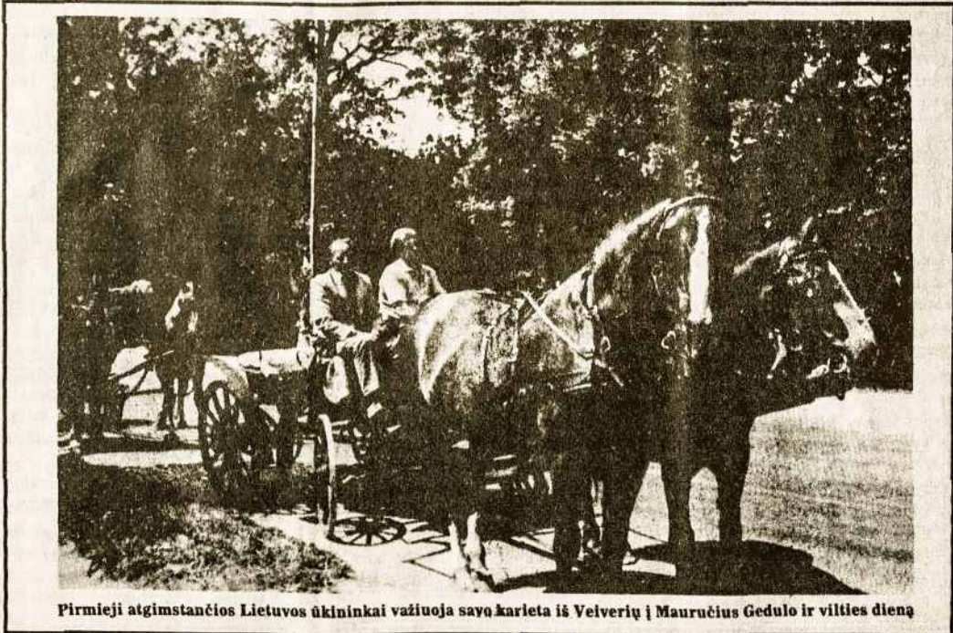
Pirmieji atgimstančios Lietuvos ūkininkai važiuoja savo karieta iš Vėlverių į Mauručius Gedulo ir vilties diena