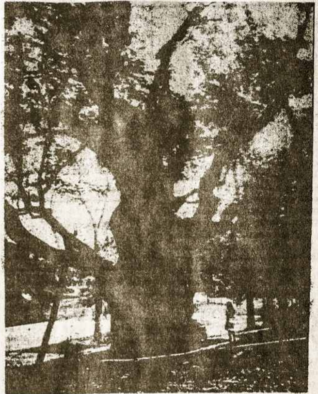
Stelmužės ažuolas - istorinis paminklas Lietuvoje

Perskaitęs praeitų metų „T.Z.“ 32-33nr. apie Stelmužės ažuoliuko sodinimo iškilmes prie Balzeko muziejaus Čikagoje, prisiminiau apie tą legendinį seniausią Lietuvoje, o gal ir Europoje, ažuolą, nes vaikystėje teko jį lankyti su kitais vaikais. Akis išsprogdinę žiūrėjom į tą milžiną, rankas sukabinę matavom ažuolo kamieną, tyrinėjome jo apimtį, o kartais mokytojai mus visus nufotografuodavo. Tais laikais netoli ažuolo glaudėsi gražiai sutvarkytos vokiečių karių kapinaitės.