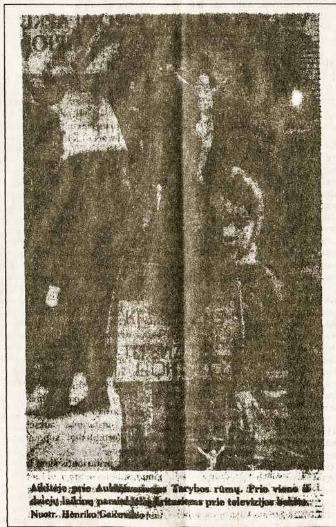
Aukštėje prie Aukščiausiosios Tarybos rūmų. Prie vieno iš šalių laikomų paminklų kritusius prie televizijos kameros.

palaikė nepriklausomos Ukrainos armijos uniformomis apsilvilkę jauni vyrai ir moterys. Švento Jurgio katedroje kardinolas Lubachivski drauge su kitais ukrainiečiais vyskupais, vadovavo iškilmingom pamaldom. Tai buvo Verbų sekmadienio pamaldos pagal senąjį Julijono kalendorių, kurio tebesilaiko ukrainiečiai rytų apeigų katalikai. Kardinolas Lubachivski, kabėdamas per pamaldas, prisiminė nesuskaitomus Ukrainos katalikų Bažnyčios kankinius, kurie per pastarąjį penkiasdešimtmetį gyvybės auka paliudijo savo ištikimybės tikėjimui, prisimė visus kitus, kurie nepaisydami žiaurių persekiojimų neatsisakė tikėjimo. Jų kančios ir auka, pasakė kardinolas, nebuvo veltui: Stalino smurtu panaikinta Ukrainos katalikų Bažnyčia išliko gyva katakombose ir dabar, po 45-erių metų, išėjo iš pogrindžio, dvasiniai stipri, pradeda naują, daug žadantį savo gyvenimo tarpą, pasiryžusi tarnauti tikinčiųjų ir visos tautos gerovei. LRTV