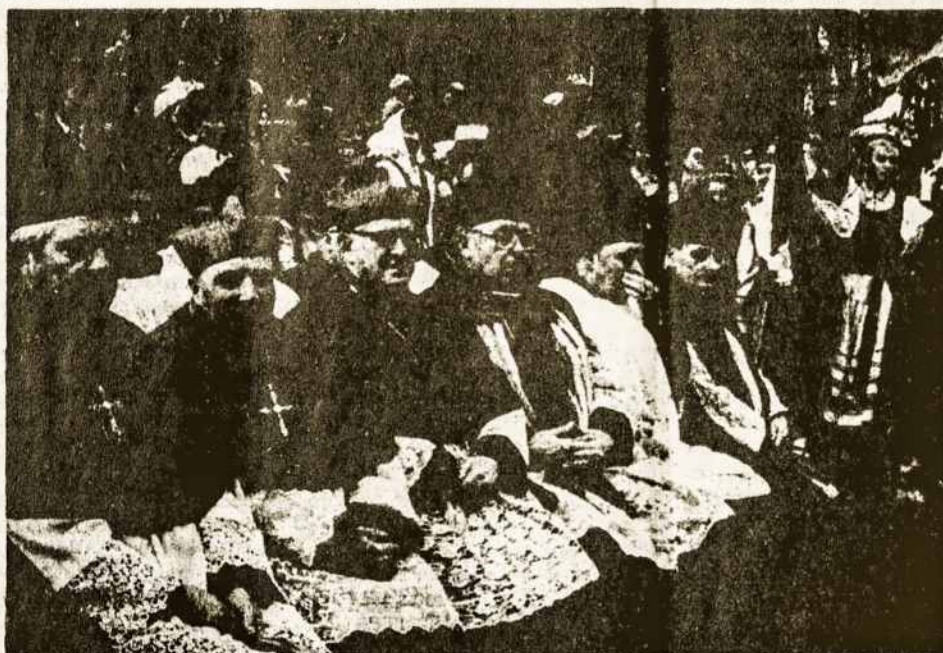
Lietuvos vyskupas vieno susirinkimo metu Kaune. Iš kairės: vysk. JUOZAS PREIKŠAS, kardinolas VINCENTAS SLADKEVIČIUS, vysk. VLADAS MICHELEVIČIUS ir kiti aukšti dvasiškiai