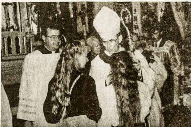
Cikagos kardinolas Jo Eminencija Juozapas Bernardinas sveikinamas Telšių katedroje. Už kardinolo pastoralo J.E. Telšių vyskupas Antanas Vaičius

Nobelio institutas Osle dar negavo žinios iš Kremliaus, ar prezidentas Gorbaciovas tikrai gegužės mėnesį atvyks į Norvegijos sostinę, kaip buvo pažadėjęs, atsiimti jam paskirtos Nobelio Taikos premijos. Gruodžio mėnesį jis negalėjo atsiimti premijos dėl įtemptos vidaus padėties Sovietų Sąjungoje. Nobelio Taikos premijos paskyrimas Gorbaciovui, kaip žinoma, Vakaruose sukėlė protestų bangą, kai sovietų kariškiai su tankais puolė valdinius pastatus Vilniuje, nužudė keliolika taikių Televizijos bokšto gynėjų. Kai kurie net reikalavo atimti iš Gorbaciovo Taikos premiją. Kilo sumanymas įteikti Lietuvos Aukščiausiosios Tarybos pirmininkui Vytautui Landsbergiui alternatyvinę norvegų tautos Taikos premiją. Per trumpą laiką Norvegijoje buvo surinkta nemaža suma pinigų, kuri kaip premija buvo įteikta Vytautui Landsbergiui Vilniuje, šių metų kovo vienuolikąją, Lietuvos Nepriklausomybės atkūrimo pirmųjų metų proga.