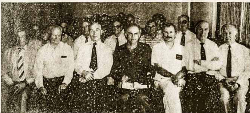
Australijos Lietuvių Dienų metu Melbourne, 1990 m. gruodžio mėn. 30 d., Inžinierių architektų suvažiavimo dalyviai.