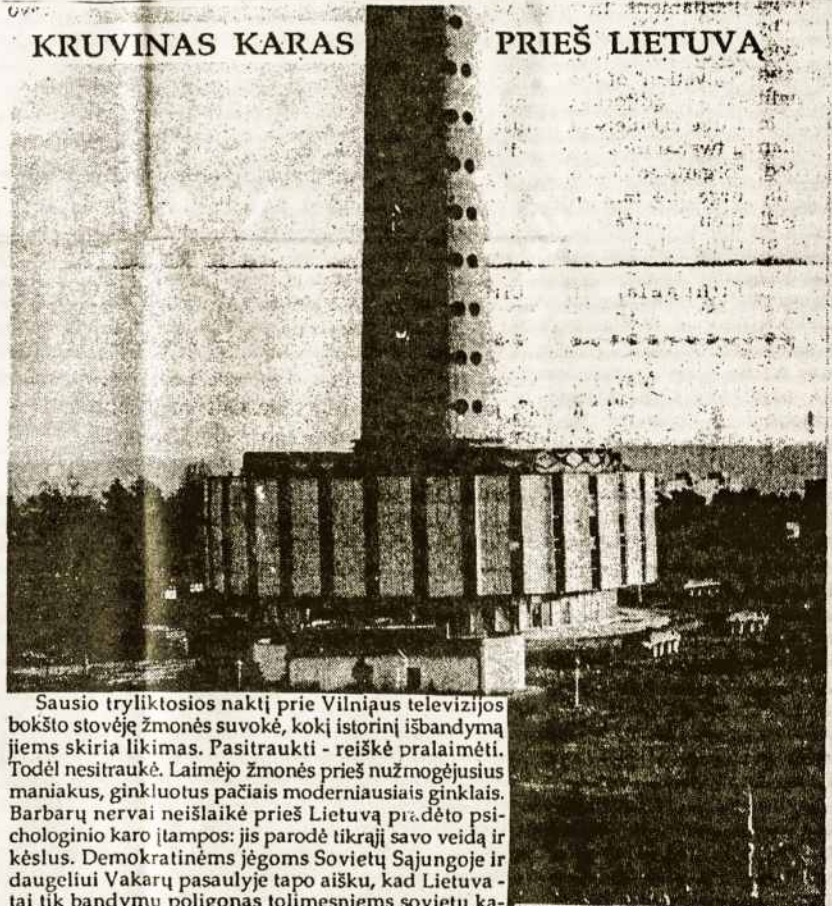
Televizijos ir radijo bokštas Vilniuje.

Israelio išsisukinėjimam grąžinti arabų okupuotas teritorijas, atrodo, ateina galas. Po visų suinteresuotų arabų valstybių priėmimo Vašingtono plano susitarimui tarp arabų ir žydų, min.pir. Shamir nesuranda kaip atsakyti nuo derybų su kaimyninėm arabų šalim. Amerikiečių viešoji opinija pradeda nusistatyti prieš buvusius ir dar esančius. S. Amerikos draugus. Jei šį kartą Israelis atsisakytų derėtis, S. Amerikos milijardinė parama Israeliiui galėtų būti sustabdyta. Žydų valstybė išsilaiko tik dėka minėtos ekonominės paramos.