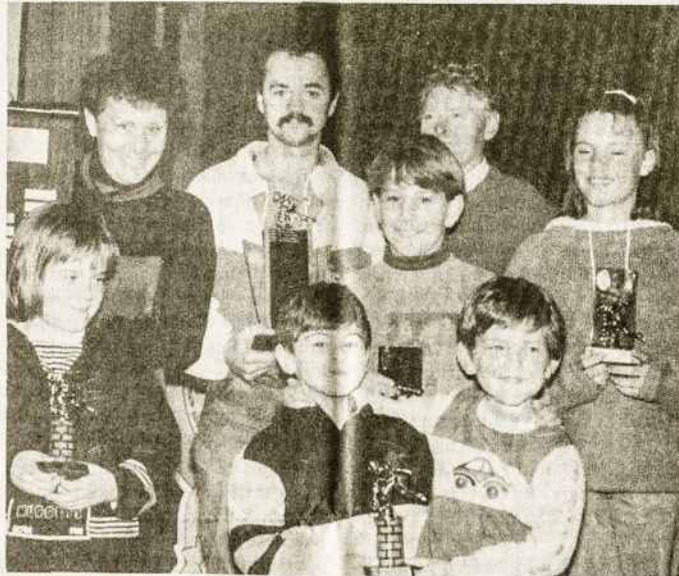
Nuotraukoje stovi antroji eilė iš kairės: