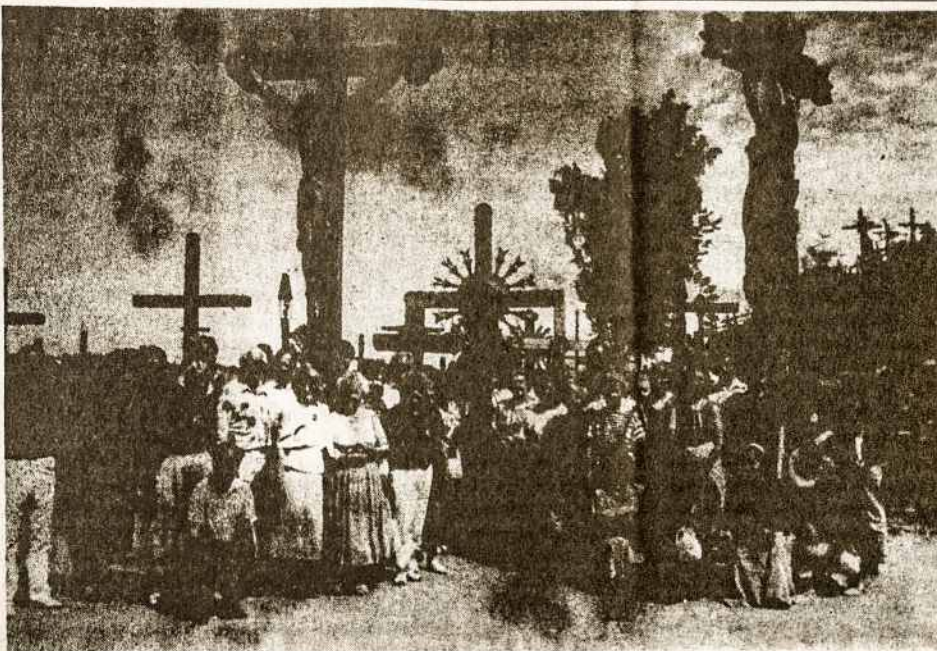
Aušros Vartų parapijos (Montrealyje) choras liepos 5 d. Kryžių kalne prie Jurgaičių pastatė ir savo kryžių.

„Gimtasias Kraštas“ rugsėjo 26 d. numeryje kviečia gyventi tautiečius be barikadinio gyvenimo, kuris per 50 metų išugdęs tipą žmonių, „kurie gali gyvuoti, pramisti, tik demonstruodami superlojalumą ir nuolat tikrindami, aiškindami kitų atsivaimą. Mat niko kito nesugeba.“ „Kitaip,“ sako laikraštis, „vėl reikėtų politrukų, kurie geriausiai žino, kuri linija dabar teisingiausia, kam tarnauja viena ar kita mintis, tas ar kitas pilietis.“