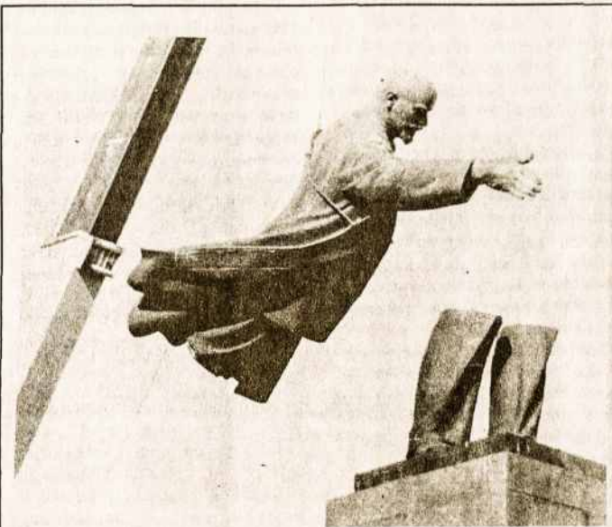
Taip "apaštalas" Leninas, palikęs savo kojas, plaukia per orą Vilniuje rugpjūčio 23 d.