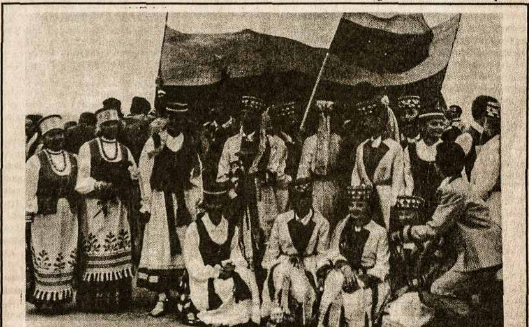
Lietuvos jaunimo grupė, 1989 metais iškėlusį trispalvę Gedimino pilies bokštė Vilniuje

(„Laiškai lietuviams“ vol. XXXIX, No. 9)