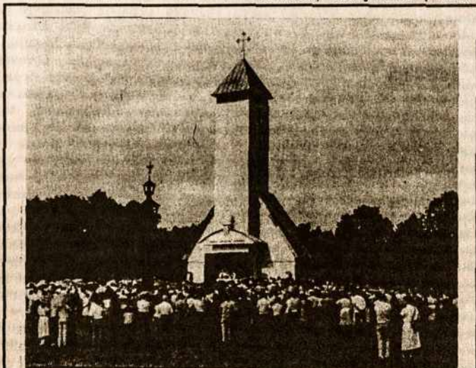
Palaimintojo Jurgio Matulaičio garbei pastatyta koplyčia jo gimtinėje - Lūginės k., Marijampolės aps., ir pašventinta 1991 m. liepos 14 d.