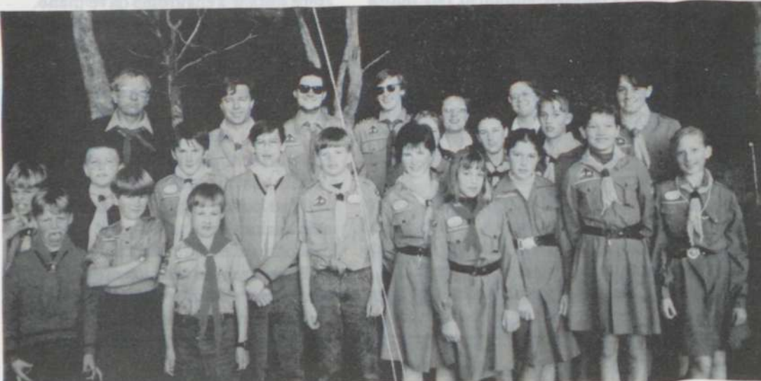
Atvelykio Stovykla Daylesford, Victoria 1992. Vilkiukai, skautės ir skautai su vadovais, stovyklavę Daylesford po Velykų.

Pigi skridimo kaina į Europą nuo $1550.00 Kelione į Vilnių ir atgal $2150 įskaitant viena nakvynę Varšuvoje ir viena nakvynę Bangkoke.