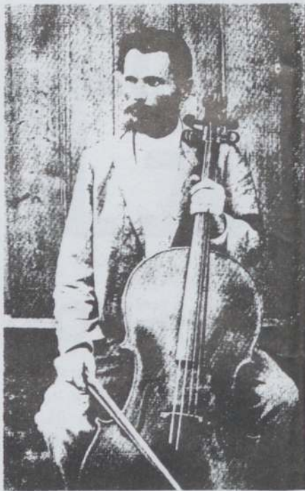
Vincas Kudirka - „Tautiškos giesmės“, tapusios Lietuvos himnu autorius (1858-1899) su savo mėgstama violončele

vieną kartą ginti šią V. Kudirkos melodiją ne vien susitikimuose su oponentais, bet ir spaudoje. Lietuvojeėjusiame žurnale „Jaunoji Lietuva“ 1915 m. nr. 1, M. Petrauskas rašė: