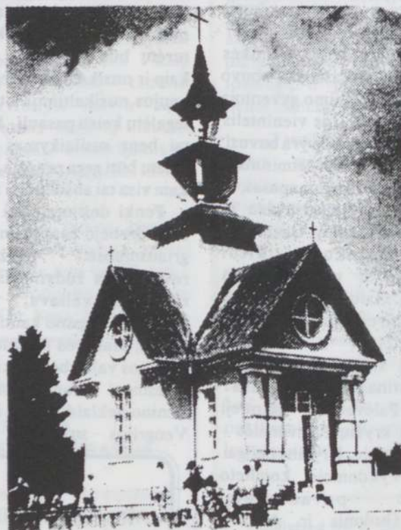
Rainių miškelyje, Telšių apskrityje, 1941 m. gegužės 24-25d. sovietiniai pareigūnai ir kariai žiauriausiu būdu nužudė 73 politinius kalinius. Jų atminimui ten pastatyta kančių koplyčia.

Bosnijoje Hercegovinoje yra dvi pranciškonų provincijos, turinčios beveik 700 brolių ir virš 100 atliekančių novicijatą. Nuo karo veiksmų smarkiai nukentėjo vienuolynų pastatai ir bažnyčios. Dabar, išlikusiuose vienuolynuose yra prisiglaudę virš 40,000 pabėgėlių.