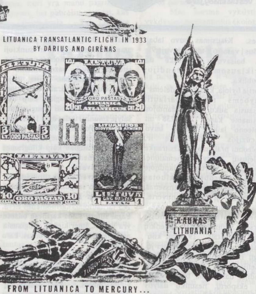
FROM LITUANICA TO MERCURY...

Jaunoji Lietuva! Tavo dvasios įkvėpti, mes stengiamės tą pasirinktą uždavinį įvykdyti. Mūsų pasisekimas tegu sustiprina Tavo dvasią ir pasitikėjimą savo jėgomis ir gabumais. Bet, jei Neptūnas ar galingasis audrų Perkūnas ir mums