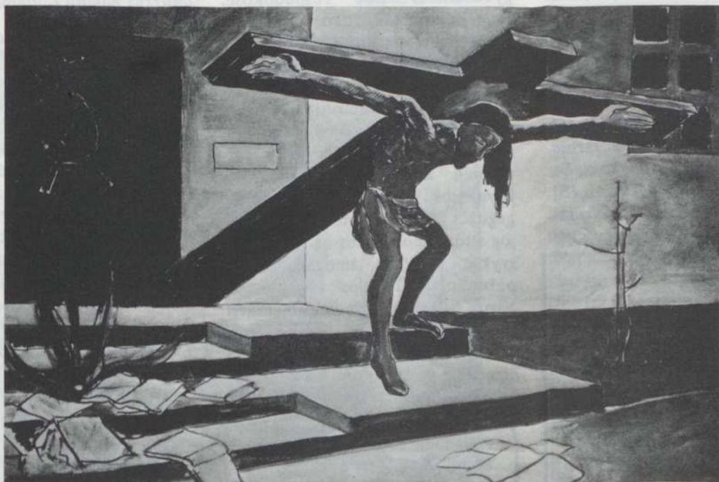
Tremtinys Kristus. (Kun. Pijaus Brazausko piešto paveikslo reprodukcija)

Kviečiame visus aplankyti Palaimintojo karstą Marijampolėje.