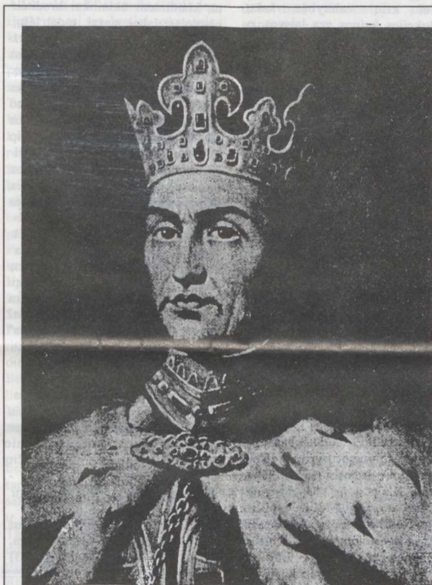
VYTAUTAS DIDYSIS žymiausias Lietuvos valdovas. Vakarų Europos kronikų rašytojai nesigailėdavo jo tėvui Kęstučiui palyginimų į pačius didžiuosius senovės pasaulio vyrus. Net ir didysis Vytauto politikos priešas Dlugošas Vytautą lygina su Aleksandru Didžiuoju - Makedonijos karaliumi.

Vytauto veiklai daug dėmesio buvo skiriama XIX-XX a. mokslinėje vokiečių, lenkų, rusų historiografijoje. Žymiausias jo