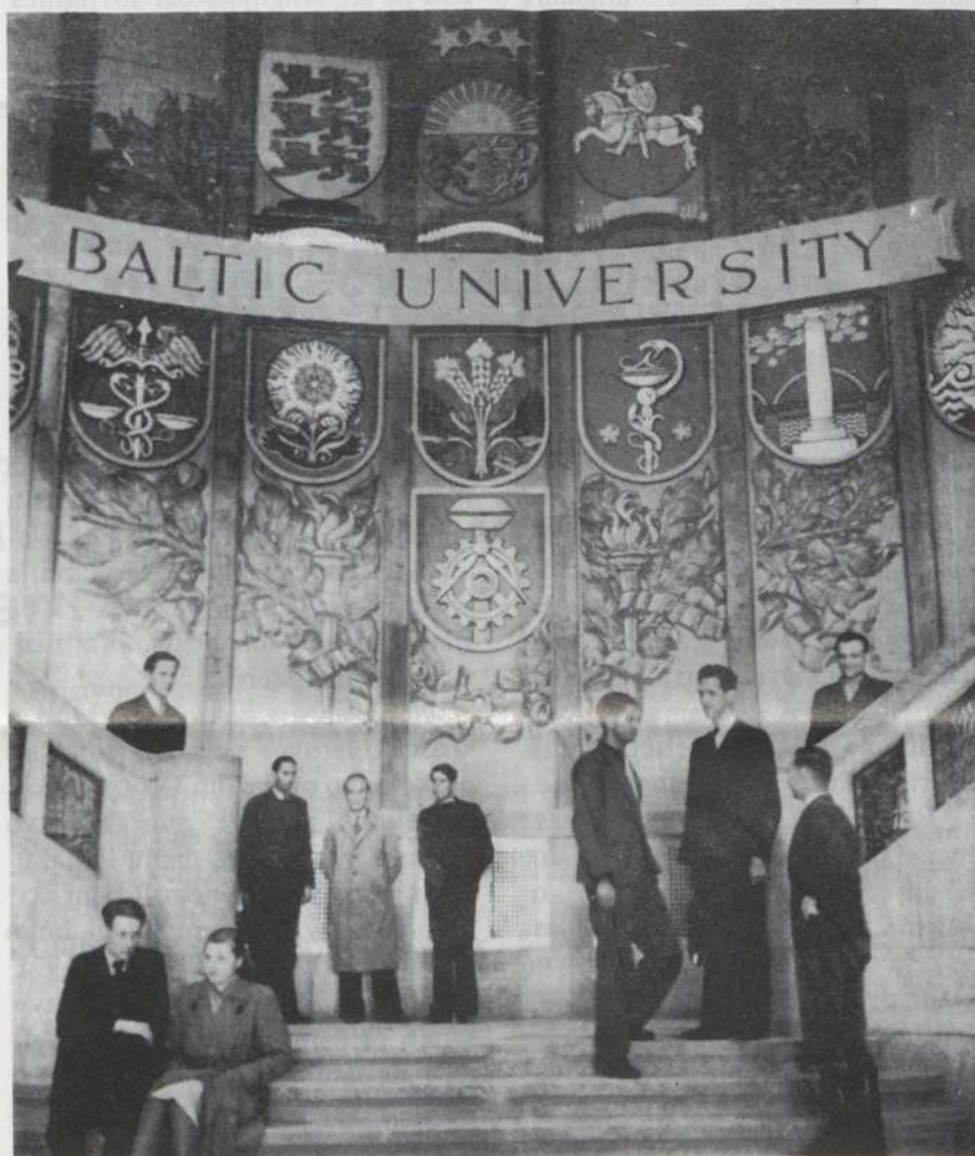
Pabaltijo universitetas. Didžioji salė - aula magna.

Žvelgiant į iš Lietuvos pasitraukusių pasiskirstymo pagal amžių statistiką, krenta į akis, kad 44% jų buvo 17-35 metų. Tai pats aktyviausias ir brandžiausias žmogaus gyvenimo periodas, ir todėl nenustabu, kad didelė dalis šio amžiaus žmonių, nepaisydami pokario sunkumų, buvo pasiryžę ir ieškojo būdų įgyti ar kelti savo profesinį pasiruošimą, studiami mokytis į universitetus. Be to, Lietuvoje, karo metu siekiant apsaugoti kuo daugiau jaunų vyrų nuo tarnybos Reiche ar kariuomenėje, buvo plačiai atvertos universitetų ir kitų aukštųjų mokyklų durys. Šios patyrisios vyresnės kartos mokslinės inteligentijos iniciatyvos dėka nuo 1941 m. iki 1943 m. Vilniaus Universitete studentų kiekis išaugo nuo 1500 iki 2000, Vytauto Didžiojo Universitete jų padaugėjo nuo 1723 iki 2750, Veterinarijos Akademijoje - nuo 22 iki 115. Tokiu būdu, karo metu Lietuvoje buvo virš 5000 akademinio jaunimo, kurio beveik pusė pasirinko tremtinio kelią. Studentai išvyko kartu su universitetų profesoriais ir dėstytojais, o tėvynę palikusios mokslinės inteligentijos būrys dar niekuomet nebuvo toks gausus - 1944 metais Vakarų Europoje atsidadė apie 400 aukštųjų mokyklų mokslinio personalo darbuotojų.