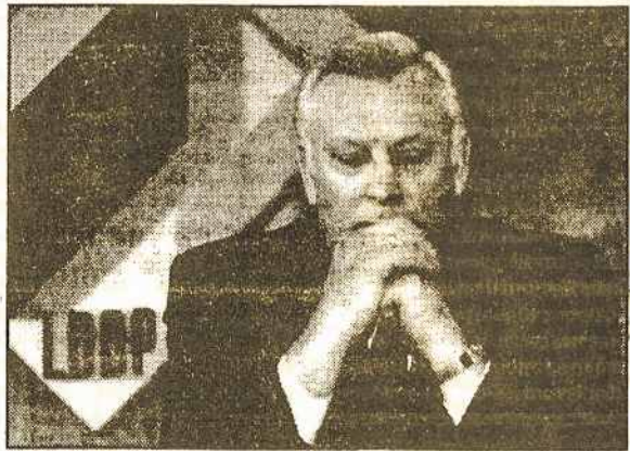
„Metų žmogus“ - A. Brazauskas.

22 proc. Lietuvos gyventojų negalėjo nurodyti žmogaus, kurį pavadintų „Metų žmogumi“, o dar 4 proc. sakė, kad Lietuvoje tokio nėra.