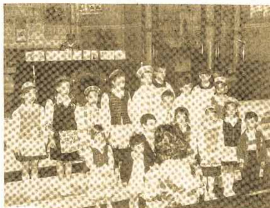
Dalis Melb. Parapijos Mokyklos mokiniai gieda mišiose gruodžio 12 d.