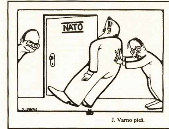
J. Varno pieš.

Nevienareikšmė reakcija Lietuvos pareiškimas sukėlė ir kaimyninių valstybių valdančiuose