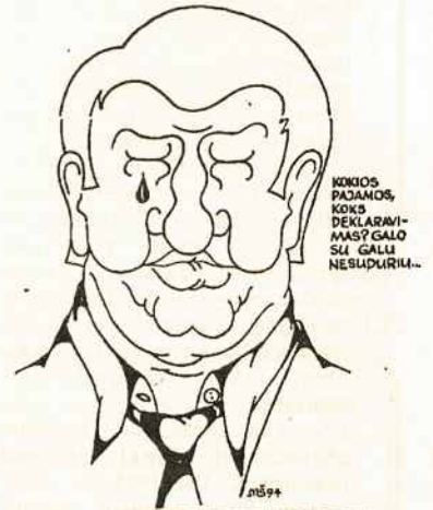
KOKIOS PAŽANOS, KOKS DEKLARAVIMAS? GALI NESPURIM... 20094