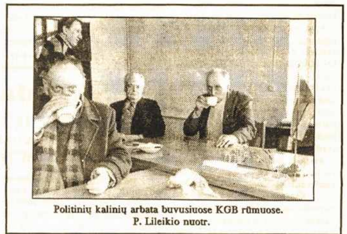
Politinių kalinių arbata buvusiuose KGB rūmuose.