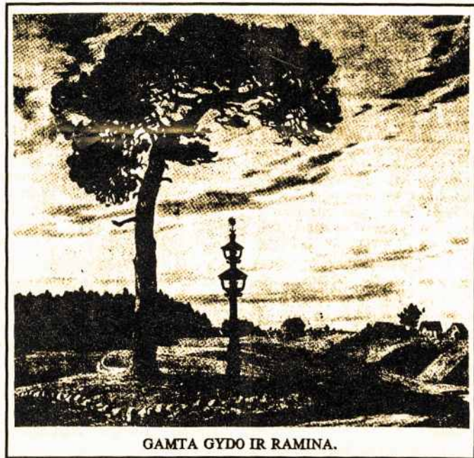
GAMTA GYDO IR RAMINA.