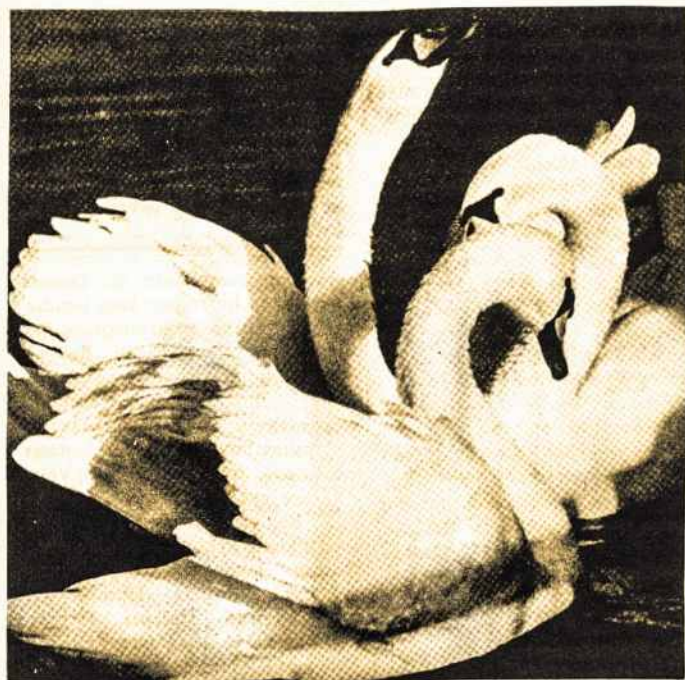
Gulbės Žuvinto ežere