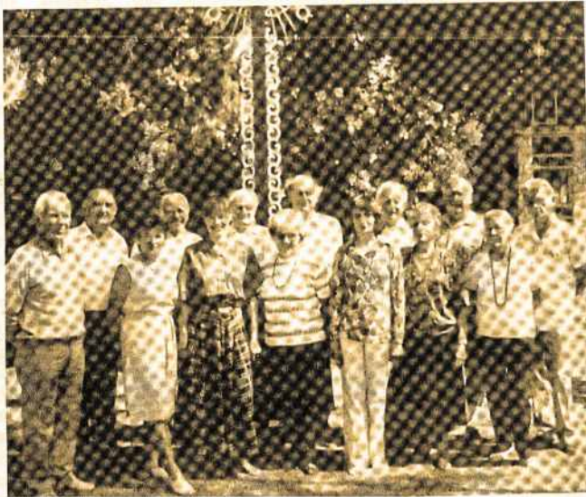
Adelaidės choristai pasirošę vykti į Pasaulio Lietuvių Dainų Šventę.

badaujančius ir Lietuvos bažnyčią paremti. Gražu, kai ateina parapijiečiai į Parapiją nešini lauknešėliai - savo skaniais pyragais, pyragaičiais, spurgom, žagarėliais ir daikteliais loterijai. D-jos V-ba labai, labai dėkinga už parėmimą mūsų darbų, už gausų dalyvavimą šioje V-bos suruoštoje popietėje. Žmonių daug, beveik pilna bažnyčia, ir salėje gyvas judėjimas, šventiškas klegesys, ilga eilutė prie pietų langelio. Ačiū visiems. S.P.