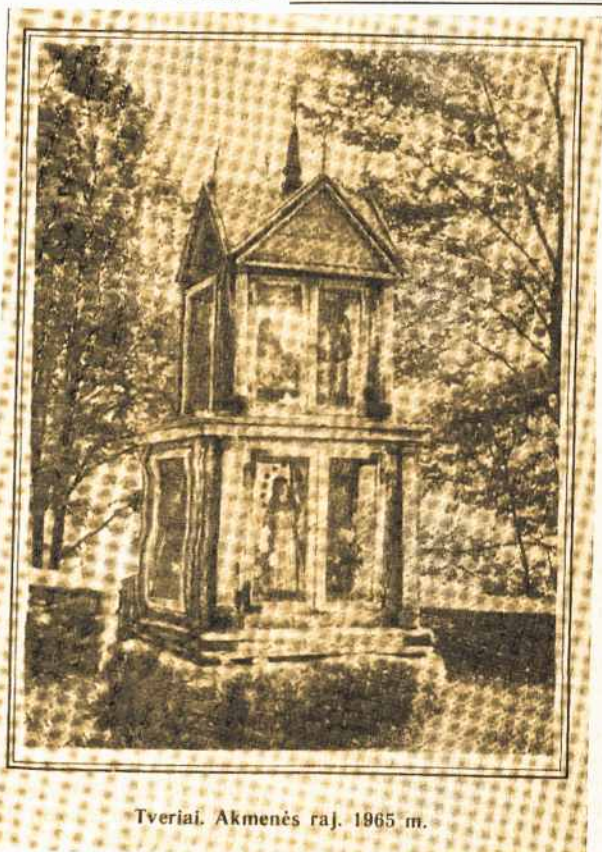
Tveriai. Akmenės raj. 1965 m.