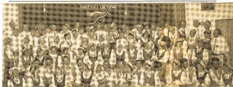
Jungtinis Australijos Lietuvių Choras ir Melb. Gintaro tautinių šokių grupė prieš išvykdam į 1994 m Pasaulio Lietuvių Dainų Šventę.

Jų dvasinė stiprybė tegul būna mums pavyzdys. Vardan tos Lietuvos vienybė tezydi.