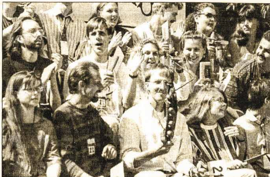
Lietuvičiai iš viso pasaulio nepabūgo išmėginti jėgų viktoringoje „Moki žodį - žinai kelią“.