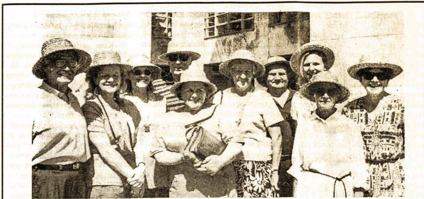
Australijos lietuviai prie Plungės kultūros namų, pasipuošę Plungės tautinių šokių „Suvartukas“ šiaudinėmis skrybėlėmis.

Po Pasaulio lietuvių dainų šventės į Plungę mūsų „Suvartuko“ šokių ir dainų ansamblis grįžo su grupe Australijoje gyvenančių lietuvių - „Žilvino“ šokių kolektyvo dalyvių, jungtinio choro dainininkų, atvykusių pasisvečiuoti Lietuvoje. Vieni pirmą, kiti - antrą ir net ketvirtą kartą.