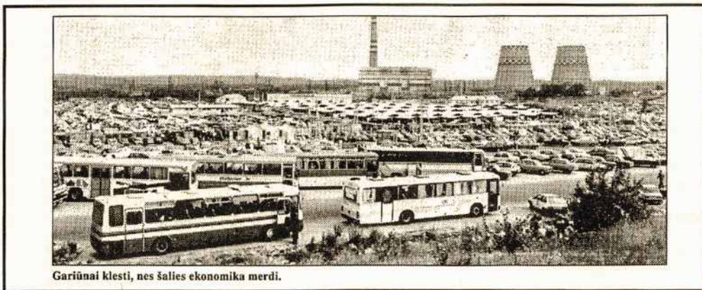
Gariūnai klesti, nes šalies ekonomika merdi.