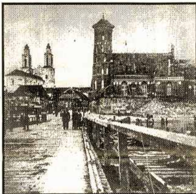
Vytauto Bažnyčia XIX a.