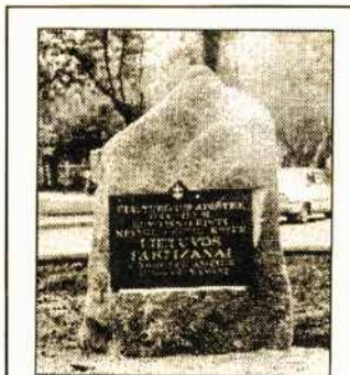
Paminklinis akmuo Ukmergėje Lietuvos partizanams pagerbti.