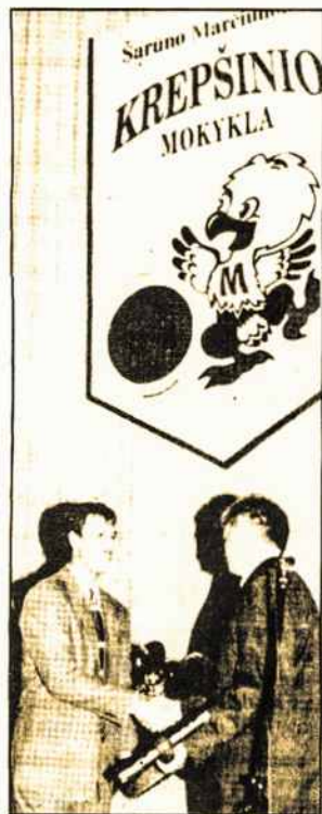
Šarūnui Marčiulionui statybininkai įteikė simbolinį mokyklos raktą.

Mokyklos šūkis - „Būk savo valios viešpats ir sąžinės vergas“. Šarūnas Marčiulionis sakė, kad jos tikslas - ne tik išmokyti vaikus žaisti krepšinį, bet ir ugdyti dvasingą, protaujantį sportininką. Naujoji mokykla - sporto kompleksas su trimis krepšinio aikštelėmis ir kompiuterizuotomis klasmėmis. Čia galės mokytis 400 berniukų. „E.L.“