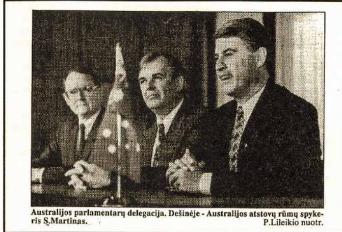
Australijos parlamentarių delegacija. Dešinėje - Australijos atstovų rūmų spykeris S. Martinas.

Kalbėdamas apie Australijoje gyvenančius lietuvius, A. Brazauskas pažymėjo, jog Pasaulio lietuvių dainų šventė bei Pasaulio lietuvių jaunimo kongresas buvo