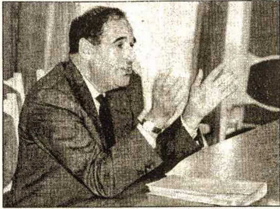
Europos Komisijos viceprezidentas L. Brittanas.