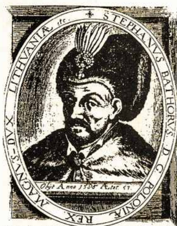
Stephanus Bathor Comes vna Polona, Groot-Hertoch vnde Lithvan, Fiortoch vna Ruffia, Prassen, Maronien etc.