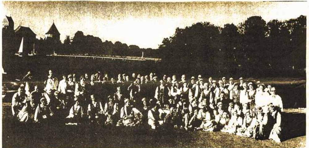
Prie Trakų Pilies - Australijos lietuviai dainininkai ir šokėjai.

Iševija atliko tris dainas, man įspūdingiausia „Siaurės Pašvaistė“. Gražūs Bernardo Brazdžionio žodžiai jau atliekami laisvoje