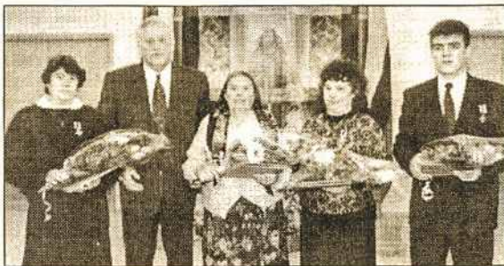
Apdovanojami su Prezidentu A. Brazausku.

Anksti rytą, 7 val. 10 min., Baltamiškio ir Vievio tarpustotėje (35 km nuo Vilniaus) buvo bandyta