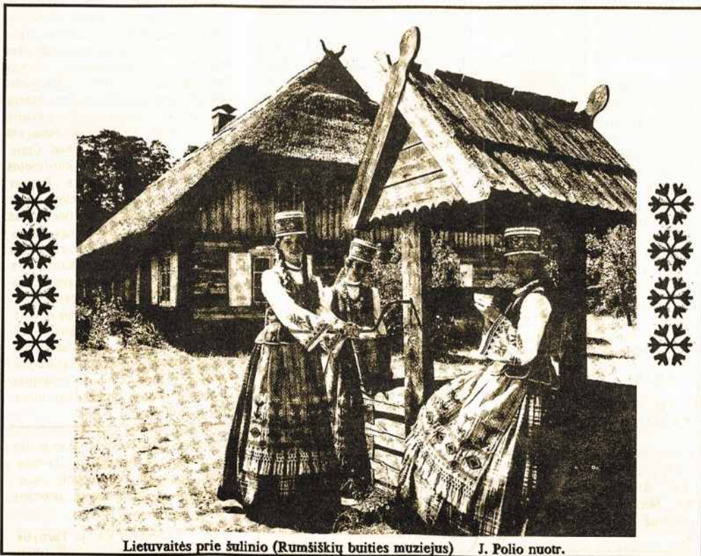
Lietuvaitės prie šulinio (Rumšiškų buties muziejus)