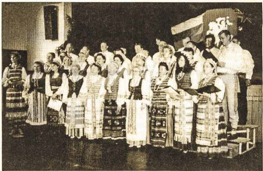
Sydnejaus „Dainos“ choras dainuoja Vasario 16-tosios minėjime Vasario 19 d.