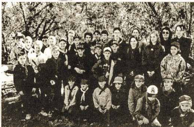
Atvelykio „Aro“ Stovykloje „Džiugo“ Tunto skautai. Aprašymas žiūr. 5-tą psl.