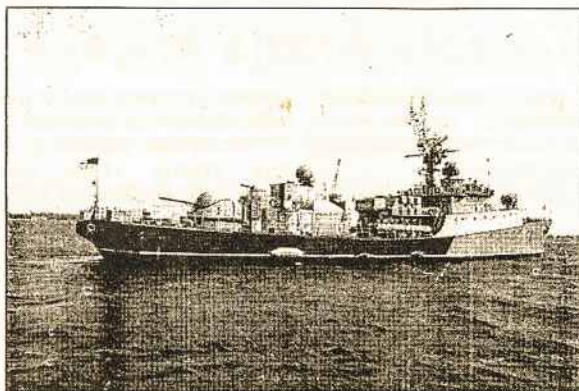
Lietuvos karo fregata „F11 Žemaitis“.