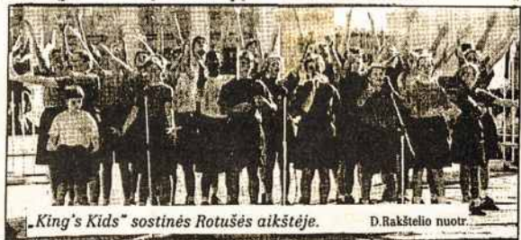
„King's Kids“ sostinės Rotušės aikštėje.

Ministras patvirtino, kad Vilniaus „Vistos“ privatizavimo dokumentai dar nepasirašyti. Įmonė taps privačia tik po to, kai naujieji savininkai sumokės 1,3 mln. litų mokesčių ir sudarys skolų mokėjimo sutartis su „Sodra“ bei valstybės biudžetu. „L.A.“